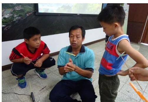
山林田野活動(蜻蜓)