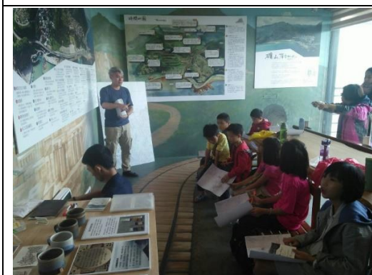
山林田野活動(社區地圖踏查)