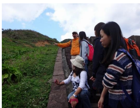
教師研習(鼻頭角步道)