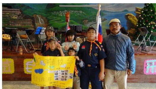
送舊鞋到非洲活動