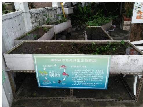
魚菜共生系統(校園內)