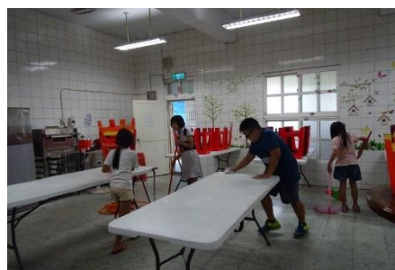
帶學生大掃除廚房