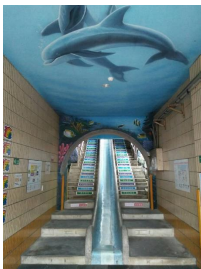
海洋環境壁畫(校園內)