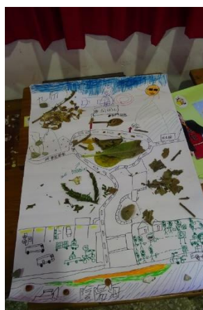
學生作品(大自然地圖)