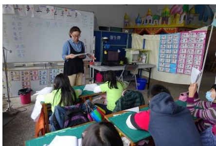
雜誌導讀(環教議題)