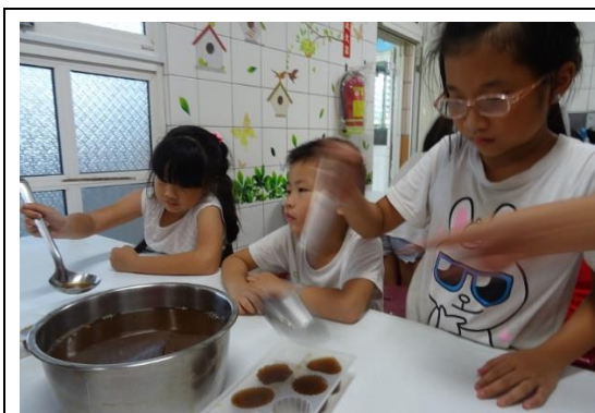
在地特色課程(製作石花凍)