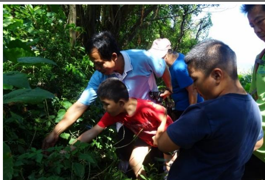
山林田野活動(蕨類)