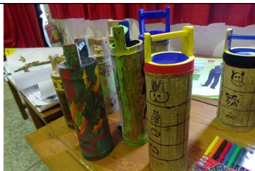
學生作品(竹筒利用)