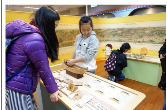
高年級參觀博物館(古地圖與交通)