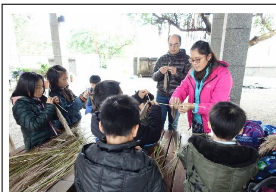
山林田野活動(芒花製作)