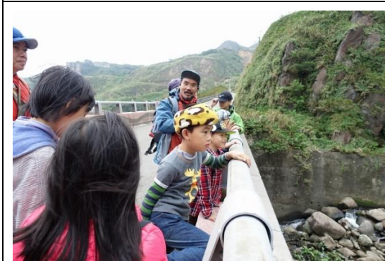
山林田野活動(單面山地質踏查)