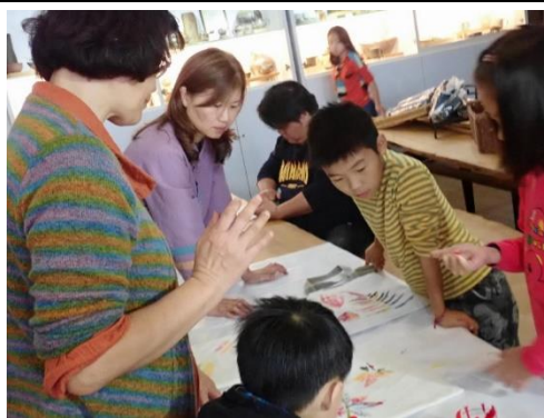
山林田野活動(葉拓環保袋)