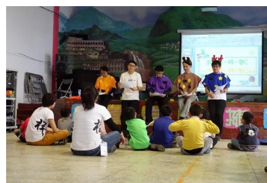
亞東營隊(環教戲劇)