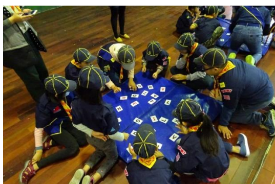
童軍活動(環境桌遊)