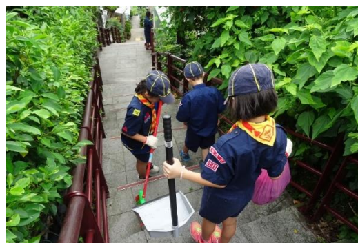
童軍打掃社區活動