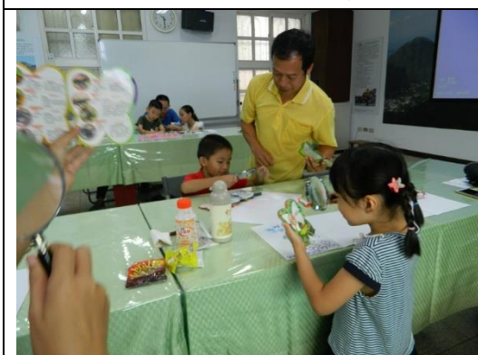
山林田野活動(蝴蝶)