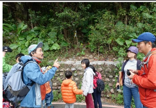
社區家長參與山林田野活動