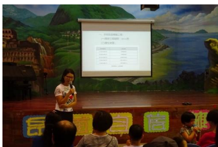
家長日宣導節能減碳