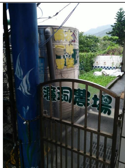
菜園、雨水回收系統(校園內)