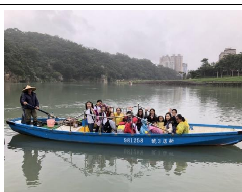
校外教學(新店渡船)