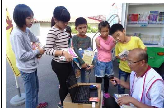
佛光山雲水書車(環教書籍介紹)