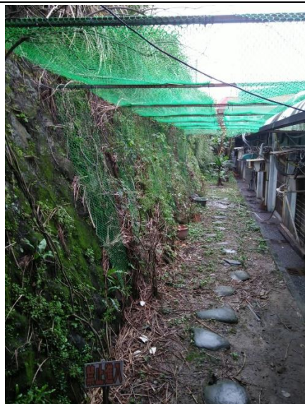
種植攀爬可食植物(校園內)