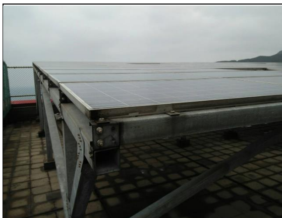
太陽能發電(校園內)