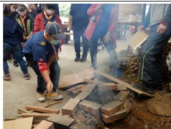
戶外教育-金山控窯