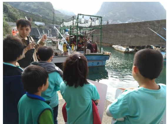
水湳洞漁港系列-中年級參觀漁船