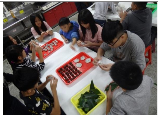
食農課程-青苧麻生態介紹及煮食方式