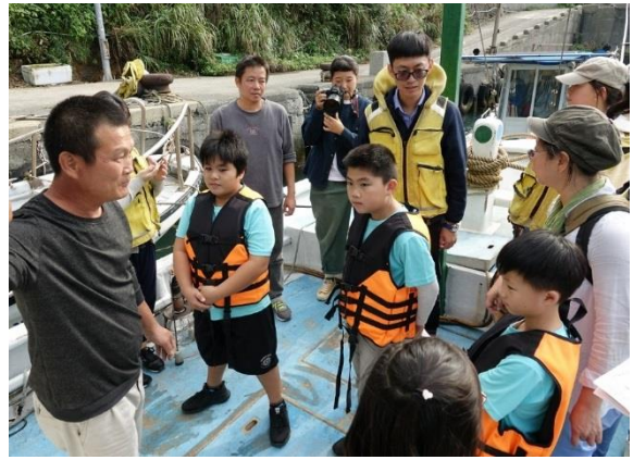
水湳洞漁港系列-參觀漁船設施