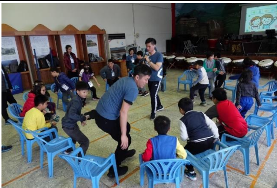
大專院校環保營隊