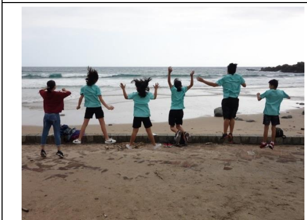
戶外教育-到金沙灣認識沙灘地形