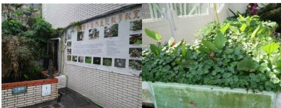
自然教學教室-生態池及魚菜共生池