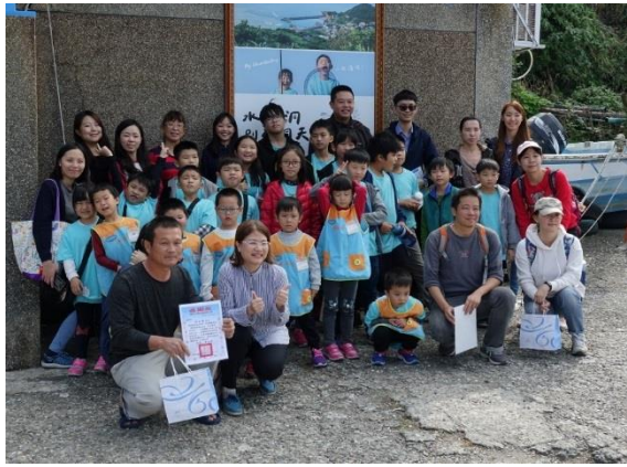
水湳洞漁港系列-參觀漁港設施及安檢所