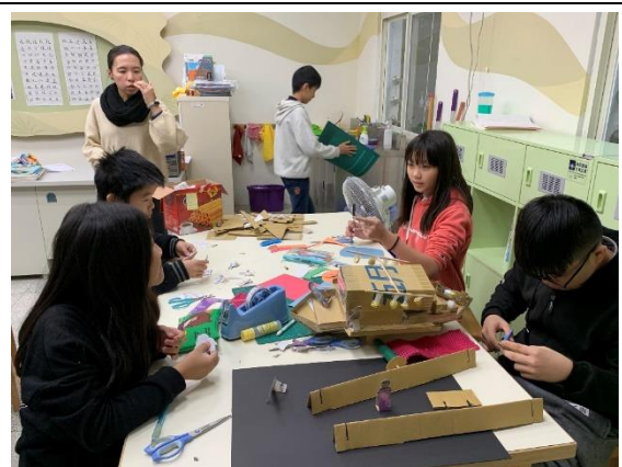
水湳洞漁港系列-高年級製作紙船