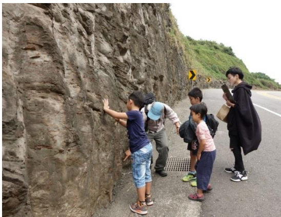
假日山林田野活動-化石拓印