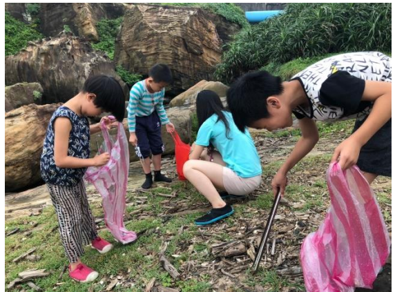
假日山林田野活動-南雅親水淨灘