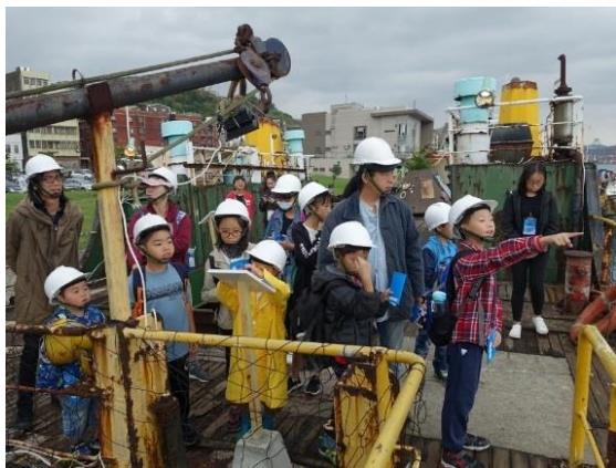
假日山林田野活動-參觀基隆潮藝術