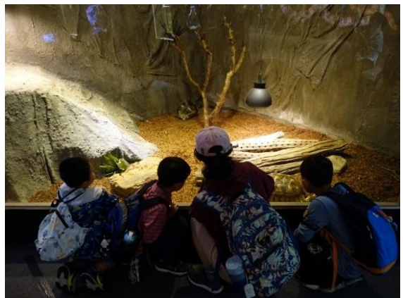
假日山林田野活動-參觀海科館