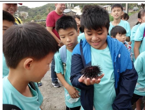
戶外教育-到九孔養殖場認識九孔生態