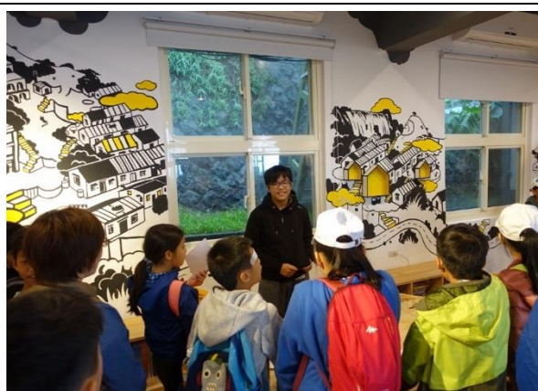
與新北市插角國小校際交流-校園環境導覽