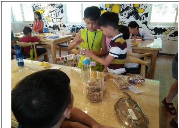
用心快樂企業親子校際交流-認識甲蟲