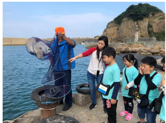
水湳洞漁港系列-低年級訪問釣客