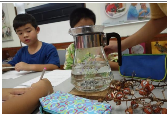
食農課程-月桃葉生態介紹及煮食方式