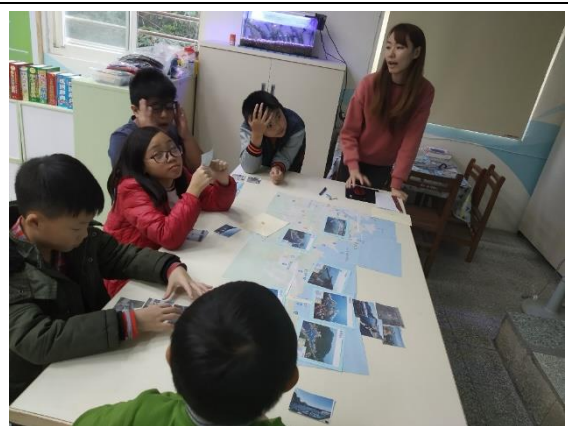
水湳洞漁港系列-中年級製作海報