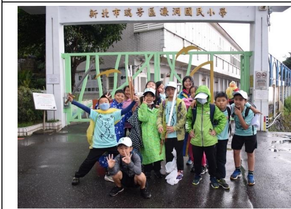
與新北市插角國小校際交流-校園環境導覽