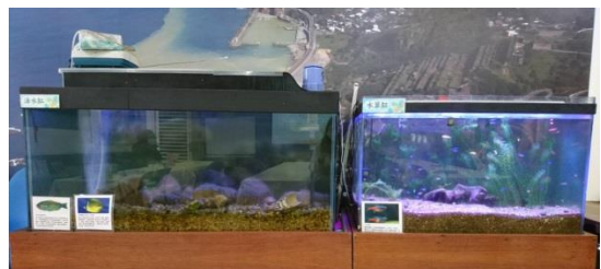
生態觀察-海水魚缸/淡水魚缸