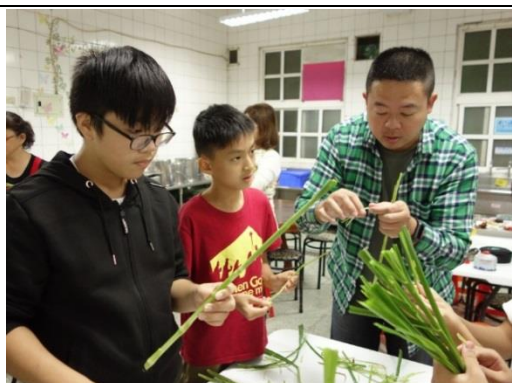
食農課程-五節芒生態介紹及煮食方式