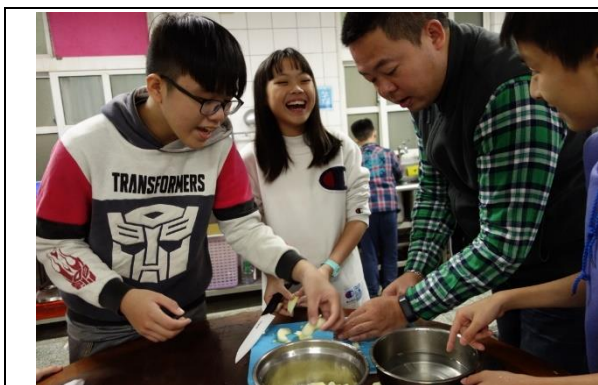
食農課程-石板菜生態介紹及煮食方式