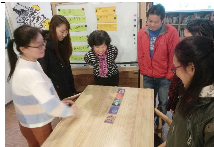
實際以桌遊卡操作