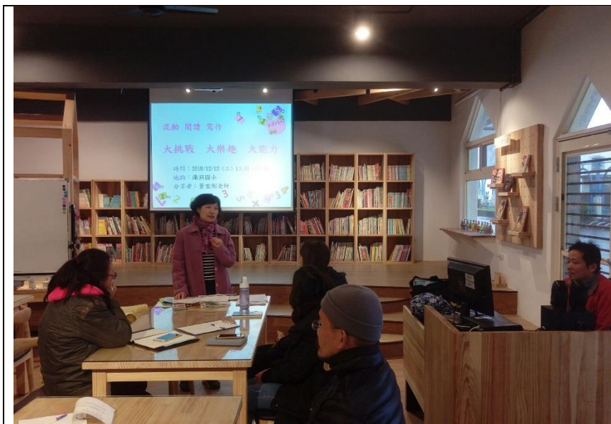
董老師介紹混齡國語文寫作活動