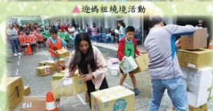
▲學校暨社區聯合運動會趣味競賽

108年5月4日「學校暨社區聯合運動會~歡迎校友回娘家」活動，內容包括「健康操、律動舞蹈及宇宙操表演」、「龍虎大隊接力」、「親子趣味競賽」、「社區路跑」等，此次活動特別邀請校友回娘家，希望校友與在校生一起藉由運動會多元有趣的活動，凝聚學校向心力，共許濂洞美好未來！