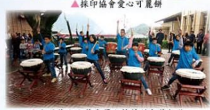
▲大肚美人山前與優人神鼓的午後相約

108年3月30日受邀與優人神鼓一同在黃金博物館區表演不一鼓，在大肚美人山前打鼓真是一幅美麗的畫面，現場觀光人潮絡繹不絕，濂洞學生帶著興奮與雀躍的心情演出，展現絕佳的大將之風，讓現場觀眾讚不絕口、獲得滿堂采！也為濂洞譜出美麗的華章！