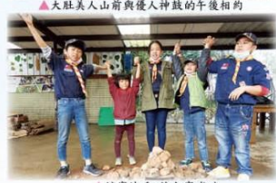
▲控置地瓜—堆土窯成功

108年4月2日全校來到萬里區的大坪國小，大家發揮創意做出各式各樣可愛又色香味俱全的pizza，吃的津津有味；接下來體驗堆土窯、一起攪盡腦汁該怎麼堆疊，在完成最困難的收尾後，有滿滿的成就感！下午和大坪國小學生進行鼓藝交流，大鼓打起來和不一鼓手感不同，感覺真有趣！有別於往年，本次兒童節活動在此舉辦，國小部與幼兒園一起合作開關的「飛車快飛」、「毛克利在哪裡？」、「尋寶卡大搜尋」驚險又刺激，真是豐富又精彩的一天。