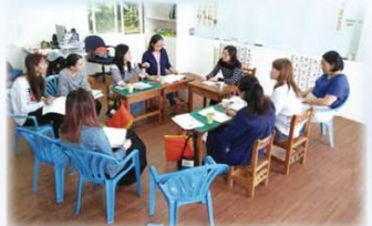
▲教學專家到校指導公開觀課