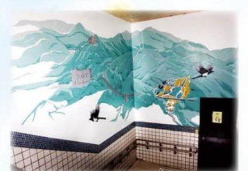
▲樓梯牆面彩繪，融入黃金山城在地元素。