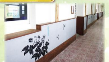
▲走廊窗下牆—在地植物手繪