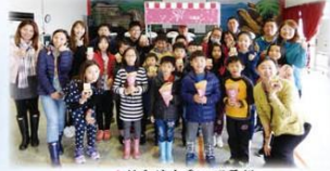
▲探印協會愛心可麗餅

108年2月12日台灣探印協會來到濂洞國小進行「生命故事分享」，帶著學生感受台灣各地真實上演的生命故事，雖然生命中有著不完美，但仍可以活出充實精彩的人生，探印協會特地邀請可麗餅師傅現場製作，讓孩子們大快朵頤，心中滿足感動與溫暖！