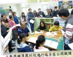
▲教學輔導團到校進行瑞芳區公開觀課

原本我們以為很困難的事，逐漸開展之後，發現不那麼困難，而且好處還不少！兩個年級的孩子一起學習，學長姊要模範、教導、協助、指揮，所以要表現得更好；而學弟妹看在許多小老師的協助下，也會學得更快更好；於是，孩子之間產生了更多的彼此相互學習，老師之間的合作也更緊密，透過同儕的備課講課及專家的指導，對學科知識結構了解透徹，也更提升了孩子的學習成效。 混齡在不同學校面臨的問題並不一致，濂洞很慶幸有信任學校的家長們、認真看待孩子學習的老師們、純樸友愛的學生同儕文化，因此做起來難度較少。期盼濂洞國小在少子化的危機中，勇敢嘗試走出一條對孩子最適合的教育方式，讓上學是件快樂且被期待的事情，老師教學越來越精湛，學生越學越有成就感，歡迎與我們有相同理念的家長，參與我們並一同形塑學校長久久的存在價值。