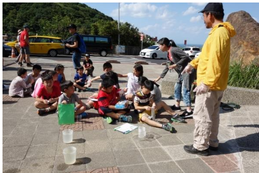
綜合課-黃金瀑布水質檢測