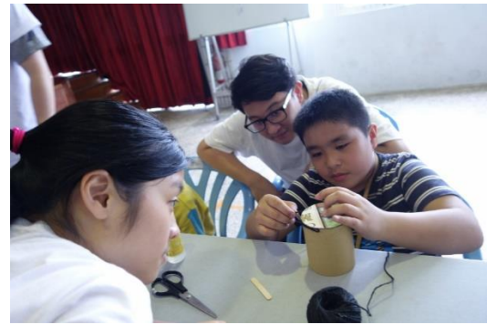
法鼓山生活環保營隊