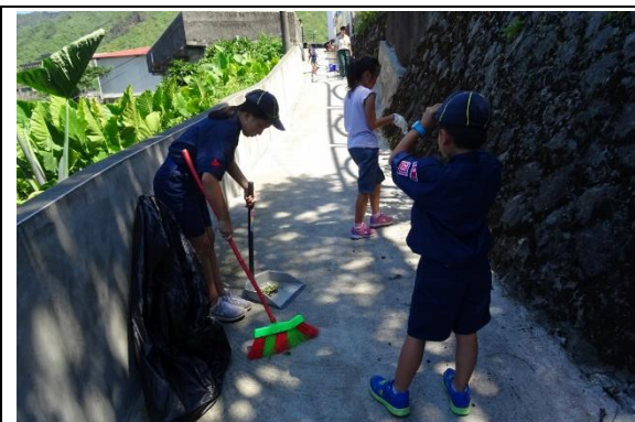
童軍打掃社區活動