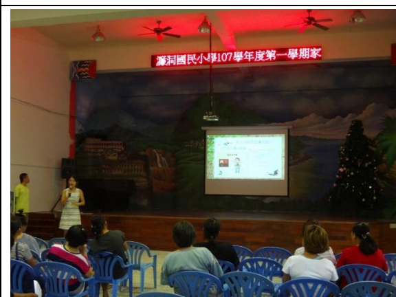
家長日環境教育宣導