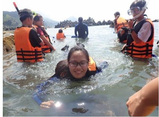
畢業生參加鼻頭國小浮潛