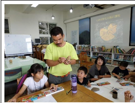
山林田野活動(化石拓印)