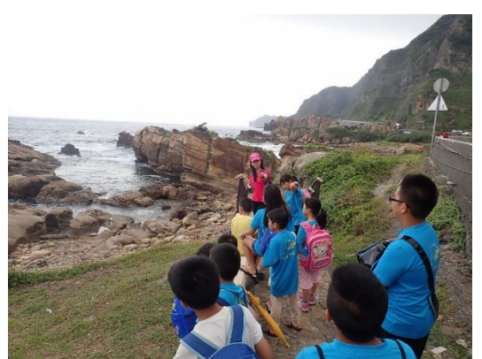
山林田野活動(南雅賞奇石)