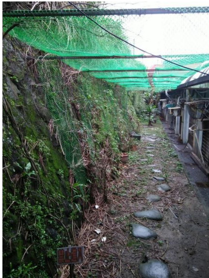
種植攀爬可食植物(校園內)