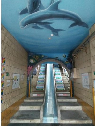
海洋環境壁畫(校園內)