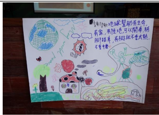
法鼓山生活環保營隊