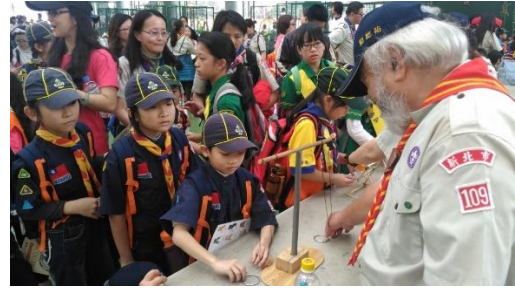
童軍參加環保園遊會