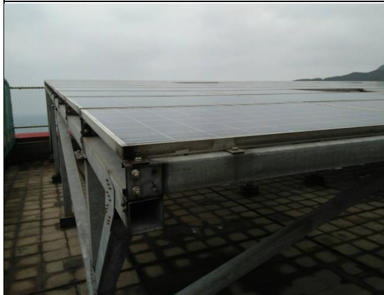
太陽能發電(校園內)