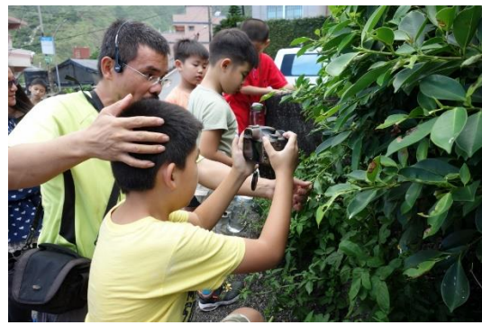
綜合課-黃金瀑布周邊植物