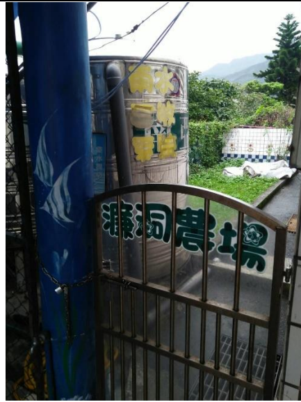
菜園、雨水回收系統(校園內)