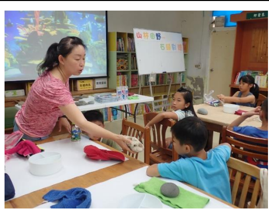
山林田野活動(彩繪石頭)