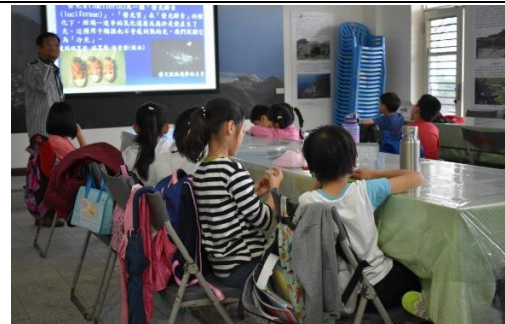
山林田野活動(螢火蟲生態及賞螢)