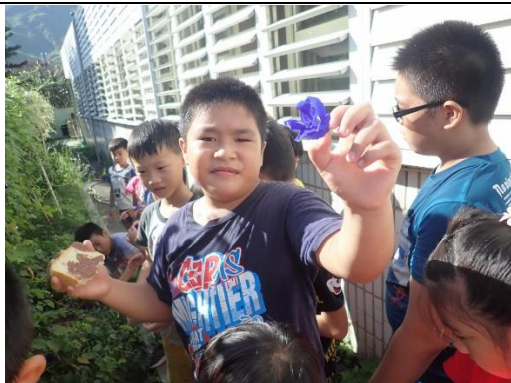
採集蝶豆花製作敬師書籤