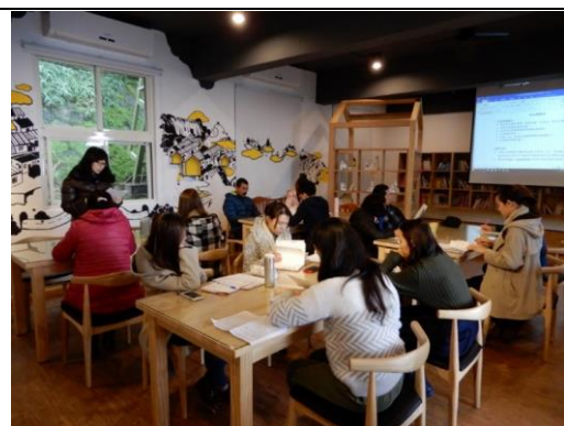
校務會議環境教育宣導