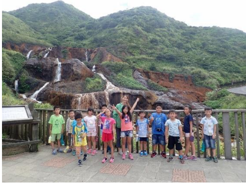
綜合課-走訪黃金瀑布