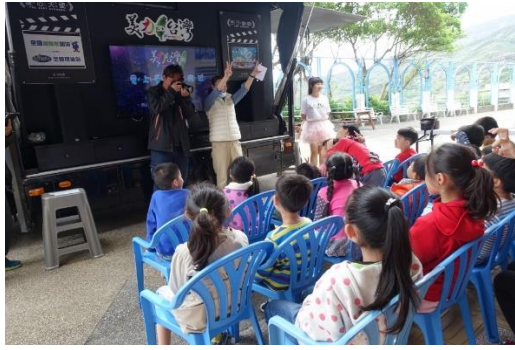
3D 電影車到校播放生態電影