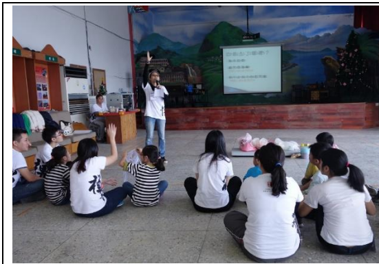
法鼓山生活環保營隊