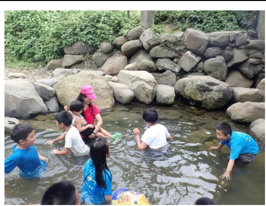
教師研習(南雅溪邊戲水)