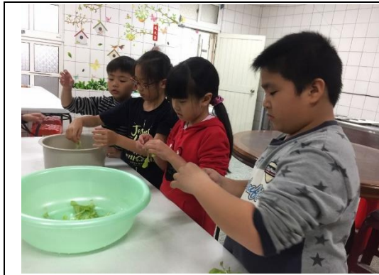
低年級生活課-自己種菜自己吃