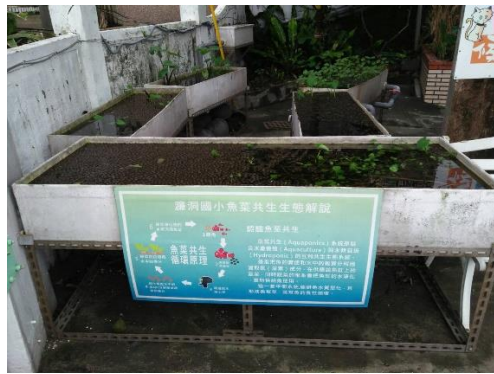
魚菜共生系統(校園內)