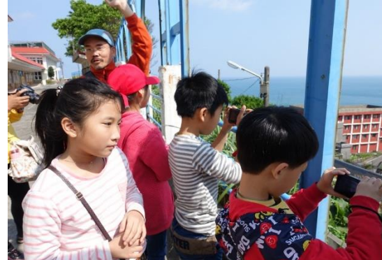
山林田野活動(生態攝影)