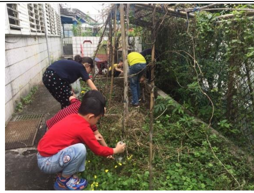
低年級生活課-自己種菜自己吃