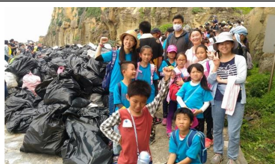
山林田野活動(阿拉寶灣淨灘)