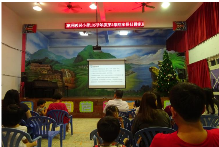
新北市濂洞國小活動執行成果照片 1(高 6cm)