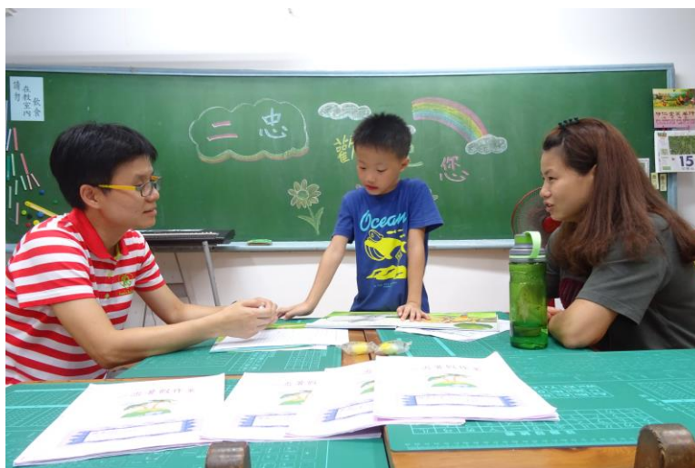
新北市濂洞國小活動執行成果照片 2(高 6cm)